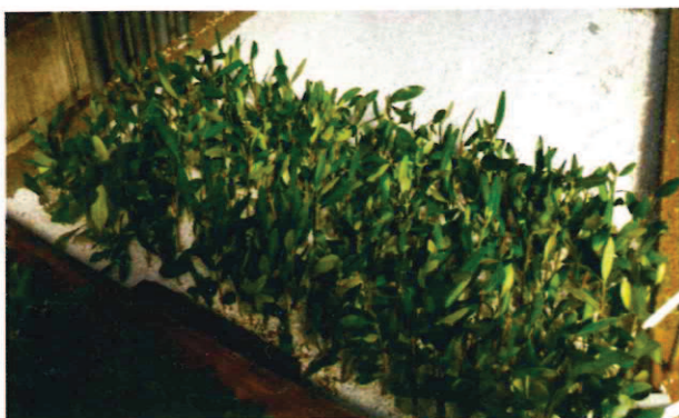
Figura 1. Talee di olivo in perlite.

La sperimentazione ha evidenziato come la zeolitite (chabasite) possa migliorare la radicazione delle talee