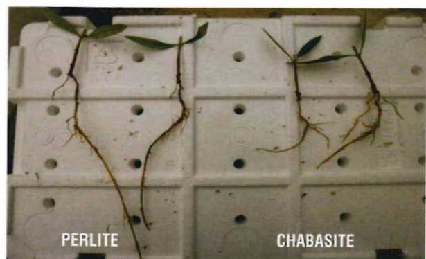
Figura 4. Effetto della zeolite su Frantoio.